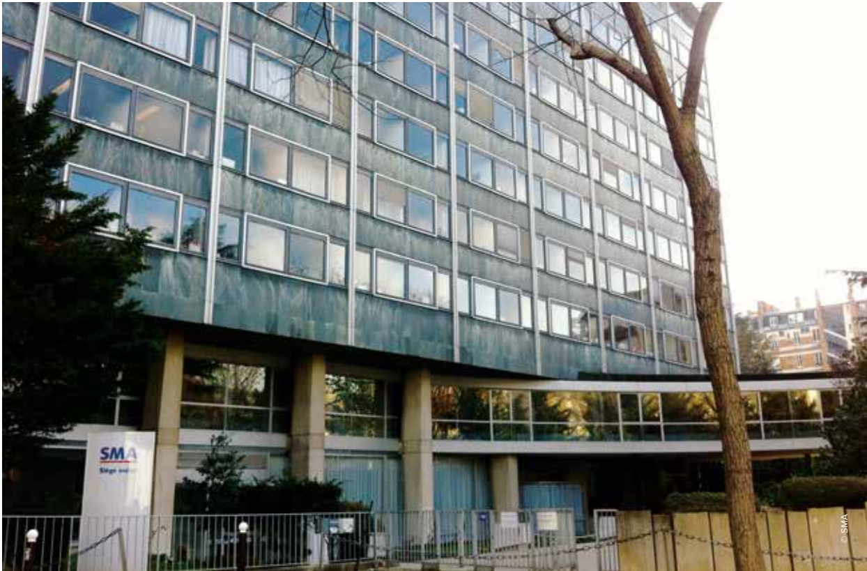
▲ LE SIÈGE AVENUE ÉMILE ZOLA (PARIS XV e ) QUI REGROUPAIT, OUTRE LA SMABTP, SMAVIE BTP.

>>> à l'échelon national durant une période comprise entre 1966 et 1976. De fait, dans ce laps de temps de 10 ans le développement du sociétariat connut une accélération de 116 %. Ce développement était encore plus dynamique en province et en banlieue où l'on comptait 172 % de sociétaires en plus. Bien que onze centres administratifs provinciaux soient déjà compétents pour le règlement des sinistres, une nouvelle organisation devenait nécessaire pour rendre un service plus global aux sociétaires et leur offrir une meilleure proximité. Pour cela deux directions à vocation géographique furent créées : la « Région parisienne » et la « Province ». À partir de la fin 1975, une multitude d'unités de gestion furent ouvertes dans les principales villes de France.